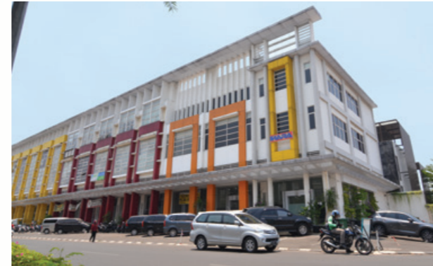
Orchard Square 2