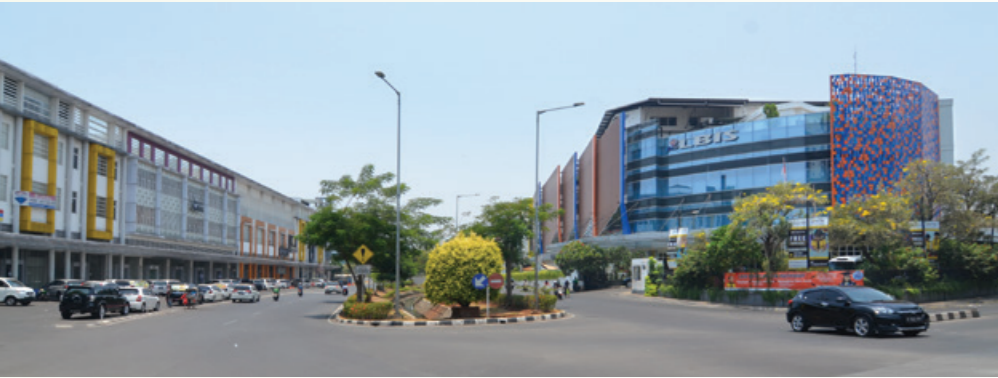
Jl. Terusan Kelapa Hybrida dan Lilin Bangsa Intercultural School (kanan)