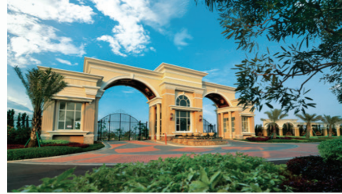
Gerbang The Royal Orchard