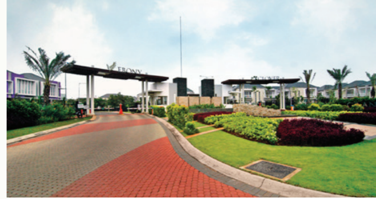
Gerbang Ebony & Clover Residence

Kini kawasan ini telah berkembang dan hidup dengan hadirnya berbagai usaha bisnis di area komersialnya serta kluster hunian yang telah dihuni sekitar 340 KK (Kluster Ebony & Clover) dan 38 unit kavling eksklusif yang sudah dibangun.